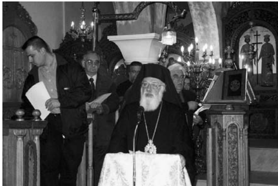
Ὁ Σεβασμιώτατος χαιρετίζει τούς ἐκπαιδευτικούς στήν ἐκδήλωση στόν Ἱ. Ν. Ἀγ. Κων/νου καί Ἑλένης.

❖ Εἰδικὴ ἐορταστικὴ σὺνάξη γιά τούς ἐκπαιδευτικούς κάθε βαθμίδος διοργάνωσε ἡ Ἱερά Μητρόπολη πρὸς τιμὴν τῶν Τριῶν Μεγάλων Ἱεραρχῶν, προσστατῶν τῶν Ἑλληνοχριστιανικῶν Γραμμάτων. Ἡ ἐκδήλωση ἐγινε τήν Πέμπτη 31 Ἰανουαρίου στόν Ἱερό Ναό Ἁγίων Κωνσταντίνου καί Ἑλένης Κοζάνης