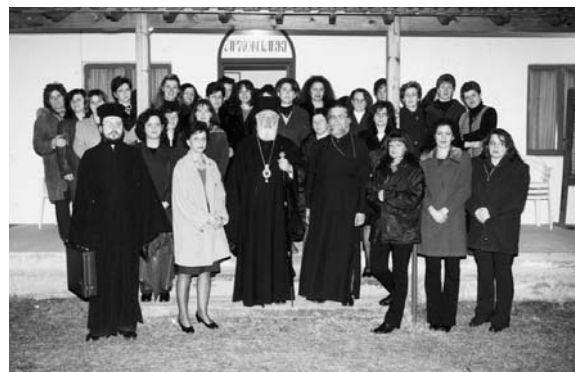
Ἀπὸ τὴν ἐκδήλωση γιά τίς μικρομάνες στό Ἀρχονταρῖκι τοῦ Βελβενδοῦ.

❖ Ὁ Σεβασμιώτατος Μητροπολίτης, μέ τὴν εὐκαιρία τῆς ἐορτῆς τῆς Ὑπαπαντῆς τοῦ Σωτῆρος, δεξιώθηκε καί συνομίλησε μέ τίς μικρομάνες τοῦ Βελβενδοῦ, στό Ἀρχονταρῖκι τοῦ Ἁγίου Διονυσίου Βελβενδοῦ. Ὁ Σεβασμιώτατος μίλησε γιά τὴν ἐορτὴ τῆς Ὑπαπαντῆς τοῦ Σωτῆρος, ἡμέρα ἐορτῆς τῆς μητέρας γιά τὴν Ὁρθόδοξη Ἐκκλησία, γιά τὴν ἀξία τῆς γυναικας, τὴν ἱερότητα τῆς μάνας καί τὸν σπουδαῖο καί ἀναντικατάστατο ρόλο πού παίζει στὴ συγκρότηση τῆς προσωπικότητος τοῦ παιδιοῦ.