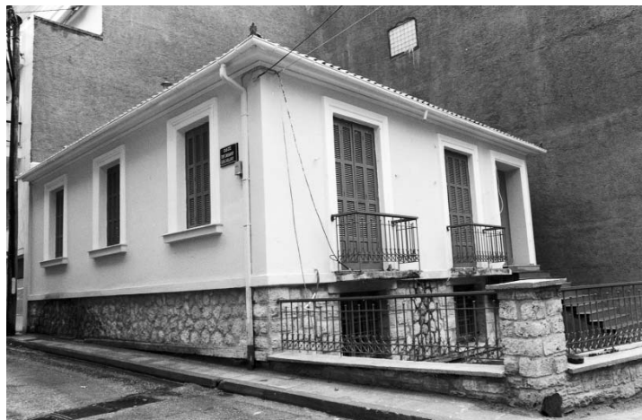
Σύντομα θὰ λειτουργήσει γιὰ τοὺς νέους μας τὸ καφενεῖο ἢ «Ρωμοσύνη», τοῦ ὁποῖου οἱ ἐξωτερικὲς ἐργασίες ἀποπερατώθηκαν.