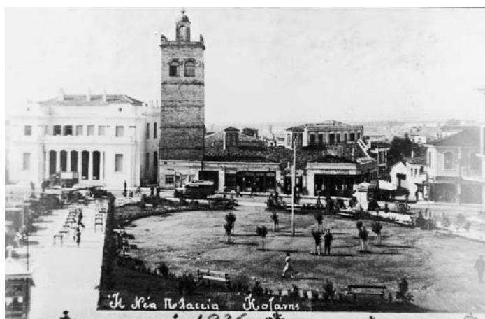
Ἀναπολόντας τὴν παλιὰ Κοζάνη.