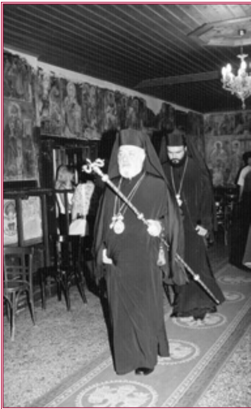
Ὁ Σεβασμιώτατος Μητροπολίτης Σερβίων καὶ Κοζάνης κ. Ἀμβρόσιος, εἰς τὸ Ἱερόν Ἐξωκκλήσιον τῆς Ὑπεραγίας Θεοτόκου.

❖ Ἐχοροστάτησε κατά τόν Μέγαν Πανηγυρικόν Ἑσπερινόν ἐπί τῇ ἑορτῇ τῆς Κοιμήσεως τῆς Θεοτόκου εἰς τό Ἱερόν Ἐξωκκλήσιον τῆς Ὑπεραγίας Θεοτόκου (Παναγία) Κοζάνης (14/8).