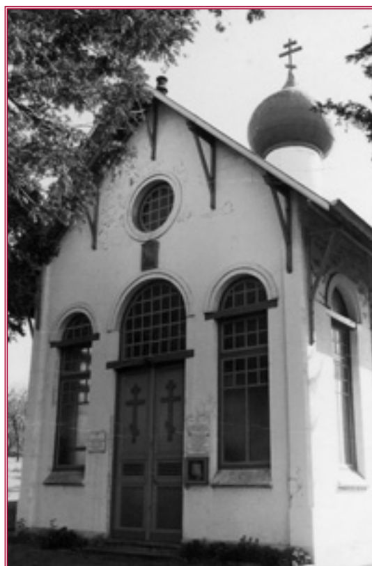
Ὁ ὀρθόδοξος Ἱ. Ν. Ἁγ. Σεργίου στὴν πόλη Colombelles.

πάρχει Ὁρθόδοξη ἐνορία στὴν περιοχή. Μετὰ χαρὰ πληροφορηθήκαμε τὴν ὑπαρξὴ ὀρθόδοξου ναοῦ στὴν πόλη καὶ τὴ δυνατότητα ἐκκλησιασμοῦ μας τὴν Κυριακὴ μετὰ τοὺς Ὁρθόδοξους Γάλλους ἀδελφούς. Ἐνας ναὸς ρώσικης ἀρχιτεκτονικῆς, λιτὸς, μετὰ πολλὲς ἐλλείψεις ἀκόμη καὶ σὲ ὑλικά λατρείας, καλεῖ τοὺς λιγοστοὺς ὀρθόδοξους νὰ ἐκκλησιαστοῦν καὶ νὰ τελέσουν τὴ Θεία