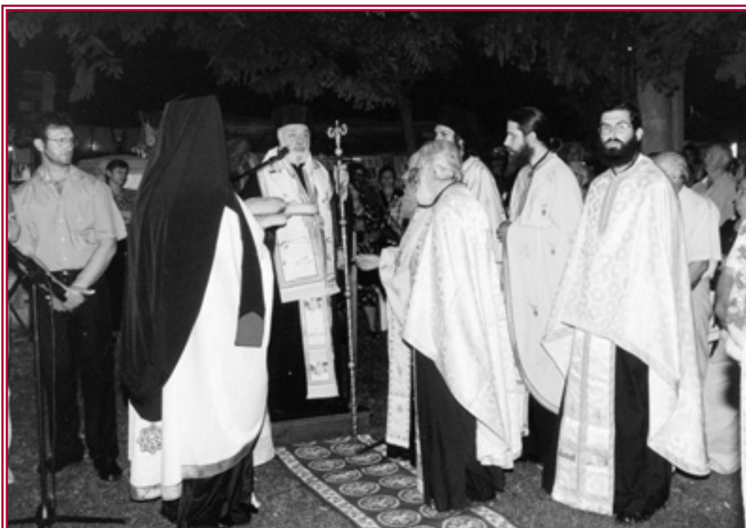
Ὁ Σεβασμιώτατος Μητροπολίτης Σερβίων καὶ Κοζάνης χοροστατεῖ κατά τόν Μέγαν Πανηγυρικόν Ἑσπερινόν τῆς Κοιμήσεως τῆς Θεοτόκου, εἰς τὸ Ἱερόν Ἐξωκκλήσιον τῆς Παναγίας Κοζάνης.