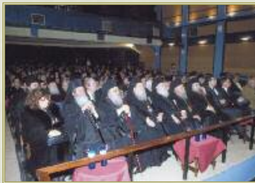
Μετὰ τὴ Θεία Λειτουργία στὴν αἴθουσα «Φίλιππος», ὅπου συνεχίστηκαν οἱ τιμητικὲς ἐκδηλώσεις.

Ἡ ἀγαθὴ μνήμη τοῦ μακαριστοῦ Μητροπολίτη μας Διονυσίου, στίς καρδιές ὅλων τῶν Κοζανιτῶν, θὰ εἶναι αἰώνια.