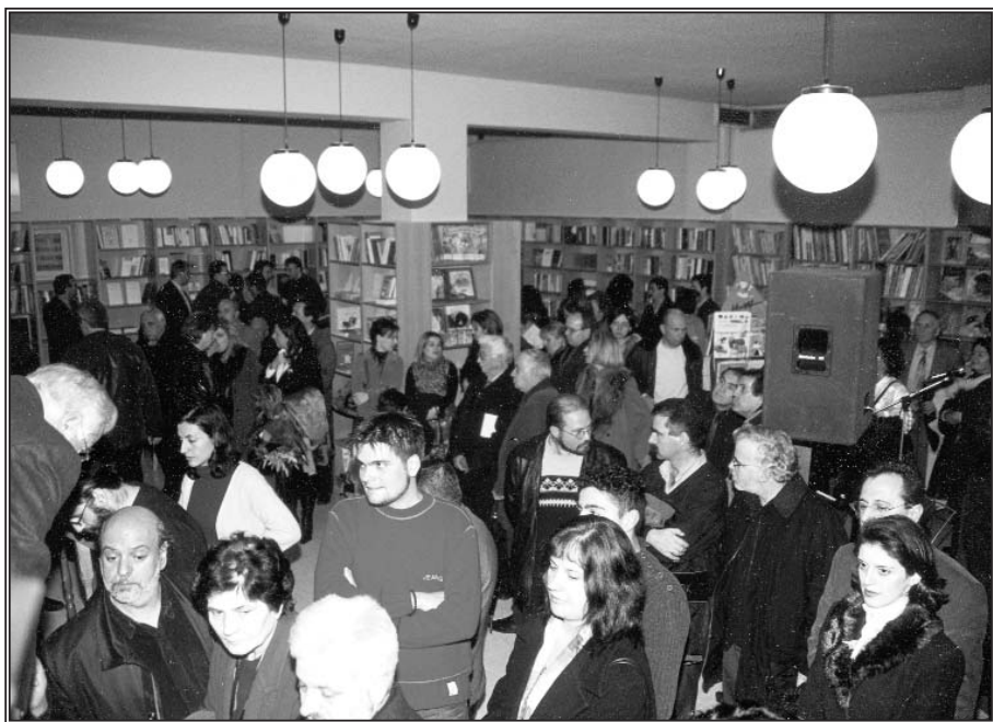
Μεγάλη ἡ ἀνταπόκριση τοῦ κόσμου γιὰ τὸ νέο Βιβλιοπωλεῖο.