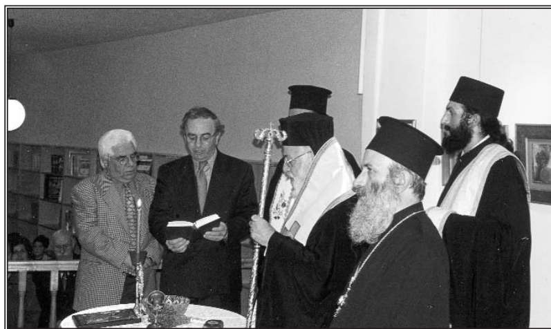
Ὁ Σεβασμιώτατος Μητροπολίτης Σερβίων καὶ Κοζάνης τελεῖ τὸν Ἅγιασμό στὸ νέο Βιβλιοπωλεῖο τῆς Ἱ. Μητροπόλεως.

Πανελλαδικῶς πρόκειται γιὰ τὸ πρῶτο Βιβλιοπωλεῖο-Πολυχώρος, ποὺ ἐκτὸς ἀπὸ Θεολογικὰ-Ἐκκλησιαστικὰ βιβλία, καλύπτει θεματικὰ τὸ σύνολο τῆς ἐκδοτικῆς παραγωγῆς καὶ λειτουργεῖ ὑπὸ τὴν αἰγίδα μιᾶς Μητροπόλεως. Πρωτοπόρος ὁραματιστῆς ὅλου τοῦ ἔγχειρήματος ὁ Σεβασμιώτατος Μητροπολίτης Σερβίων καὶ Κοζάνης κ. Ἀμβρόσιος. Ὁραμα τοῦ Σεβασμιωτάτου νὰ ἀποτελέσει ὁ νέος χώρος σκευὸς σοφίας, μιὰ μητρόπολη τοῦ πνεύματος, ἕνα χώρο φιλοξενίας καὶ διάδοσης τοῦ οὐσιώδους. Στόχος ἡ πολιτιστικὴ ἀνέλιξη καὶ καλλιέργεια κάθε πολίτη, μέσα ἀπὸ τὸ σύνολο τῶν πολιτισμικῶν κατορθωμάτων ποὺ ἀποτελοῦν τὴν κιβωτὸ τῆς ἀνθρώπινης σκέψης. Ἐνας νέος σύγχρονος χώρος Πολιτισμοῦ, ὅπου θὰ ἀναπαύεται ὁ κάθε ἀναγνώστης.