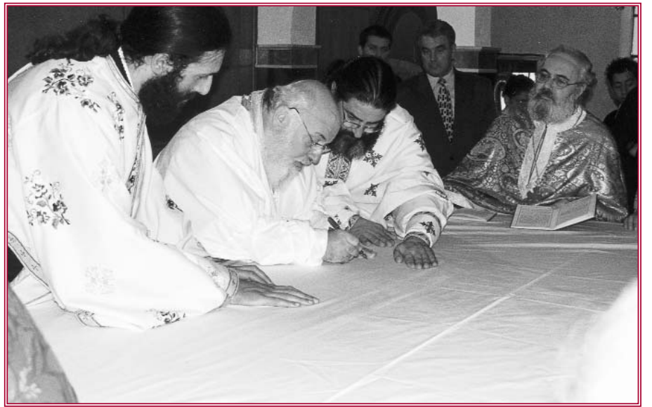
Ὁ Σεβασμιώτατος τελεῖ τὰ ἐγκαινία τοῦ Ἱεροῦ Ναοῦ Ἁγίου Κων/νου καί Ἑλένης Κοζάνης.