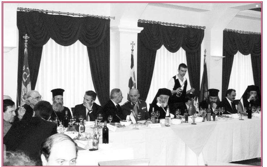
Ἀπό τό Γεῦμα πού παρέθεσε ἐπί τῆ ὀνομαστικῆ του ἑορτῆ ὁ Σεβασμιώτατος Μητροπολίτης, στή Στρ. Λέσχην Κοζάνης, ἐν μέσῳ τῶν ἐπισήμων κεκλημένων.

Ὁ Σεβασμιώτατος κ. Ἀμβρόσιος, παρέστη εἰς τήν ἀνακήρυξιν τοῦ Σεβασμιωτάτου Ἀρχιεπισκόπου Ἀμερικῆς κ. Δημητρίου εἰς ἐπίτιμον Διδάκτορα τοῦ Ἀριστοτελείου Πανεπιστημίου στή Θεσ/νίκη (19/11)· παρακολούθησε τήν ὁμιλία τοῦ ἱατροῦ - διαβητολόγου κ. Χρ. Ζούπα στό Κοδεντάρειο τῆς Κοζάνης (24/11)· τήν ἐκδήλωσιν χορευτικῶν συγκροτημάτων στό Πνευματικό Κέντρο Βελβενδοῦ (1/12). Ὑποδέχθηκε τήν Γ.Γ. Περιφέρειας Δυτ. Μακεδο-